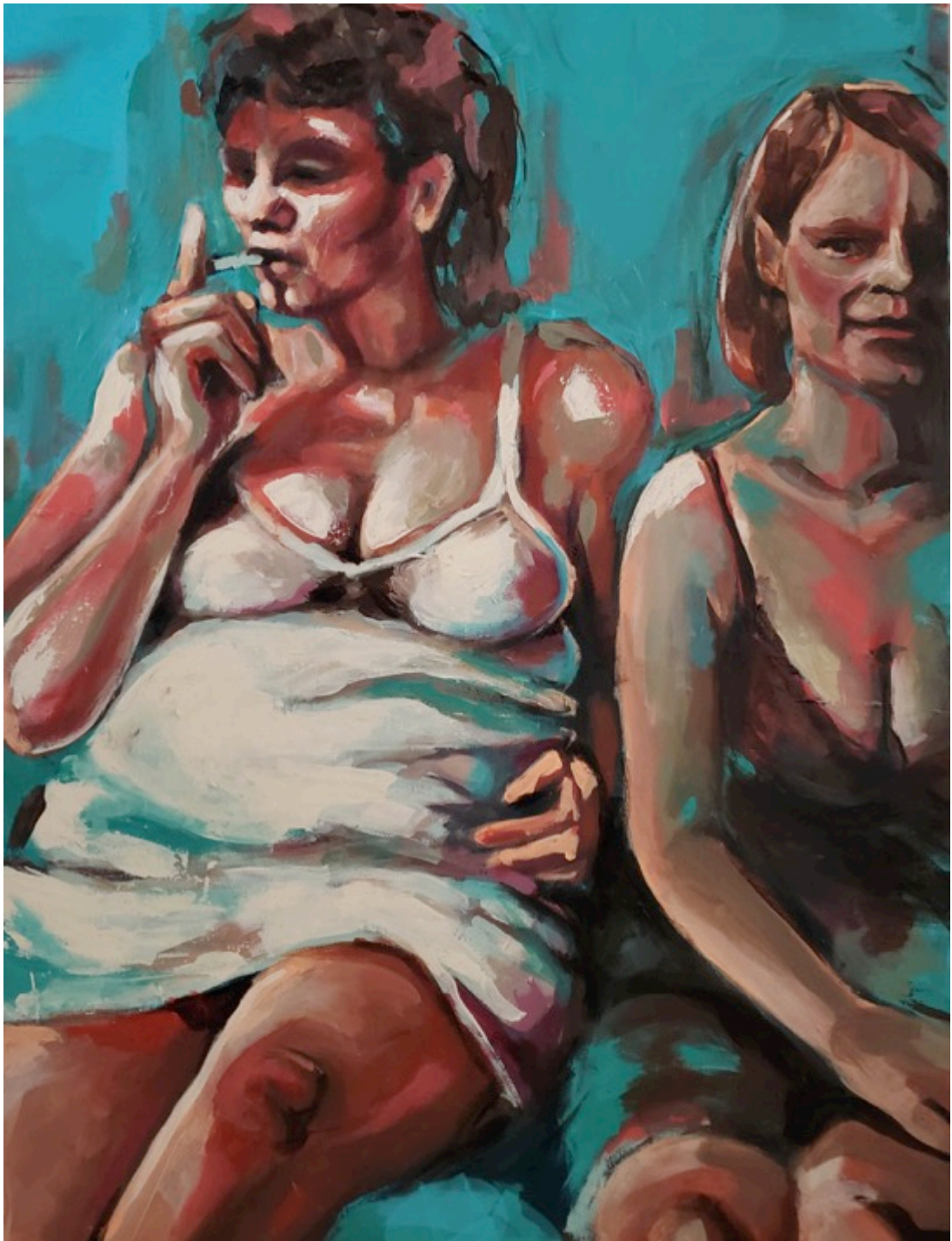
Pequenas Liberdades, 2020 Pintura acrílica sobre tela 80x60cm