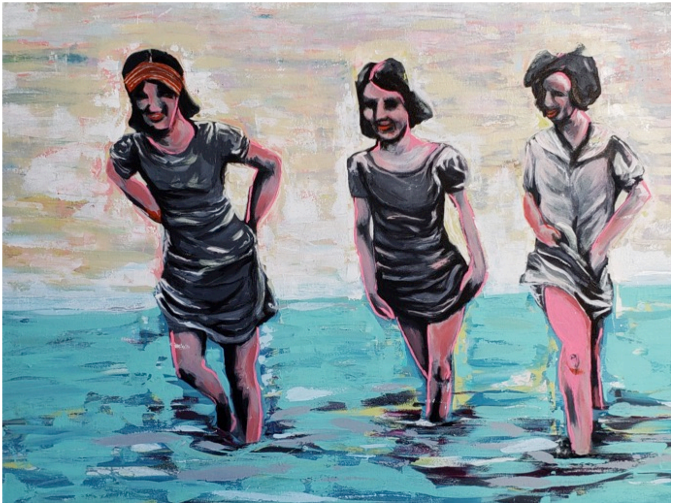
Marias, 2019 Pintura acrílica sobre tela 70x100cm