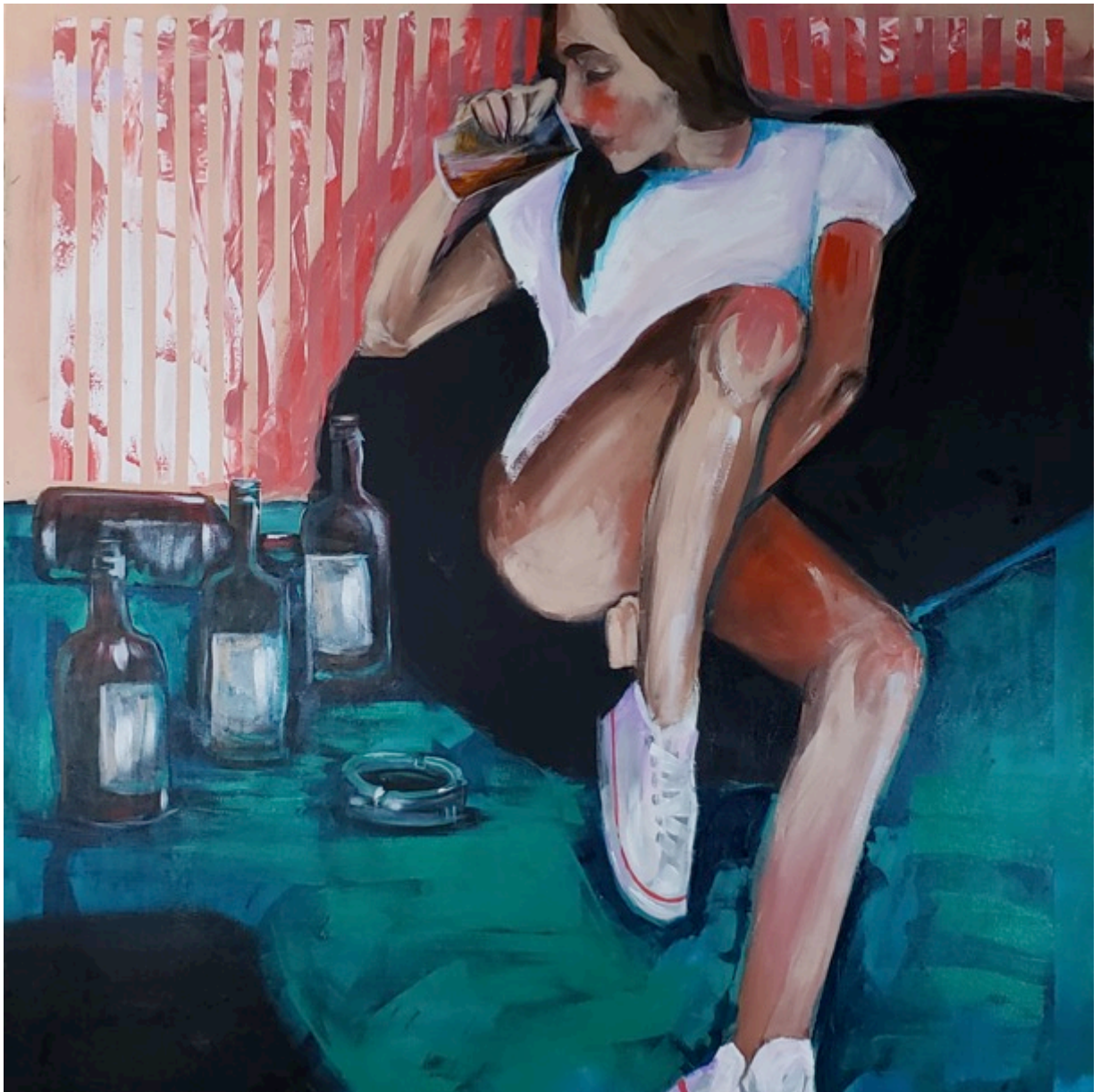
Afterparty, 2020 Pintura acrílica sobre tela 90x100cm