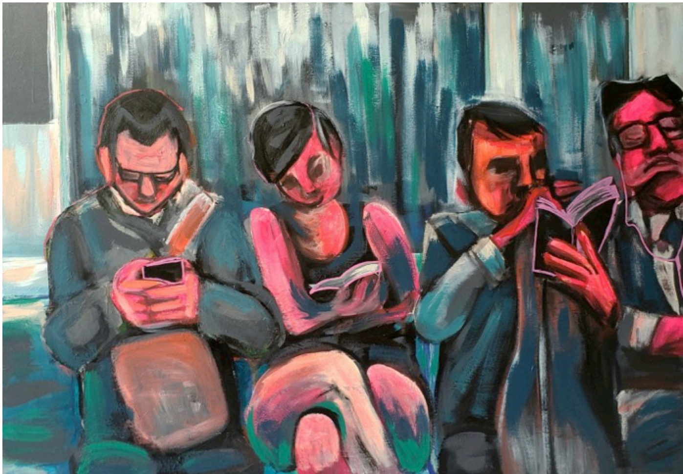
Pessoas invisíveis, 2020 Pintura acrílica sobre tela 80x60cm